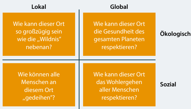
Abbildung 2: Die vier Linsen des City-Porträts